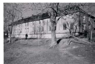
Bilder fra 1930 - tallet.