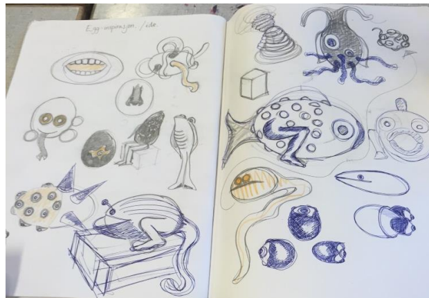
Her er to av sidene med ideer fra arbeidsboka.

Oppgaven fikk meg til å tenke på kunstretningen surrealismen. Jeg søkte på nettet etter surrealistiske bilder og skulpturer. Ideene og skissene mine ble videreutviklet av dette. Under sees noen av de bildene jeg lot meg inspirere av.