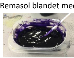
Remasol blandet med farge.

Rammene måtte tapes med gaffatape før de kunne brukes til å trykke med.